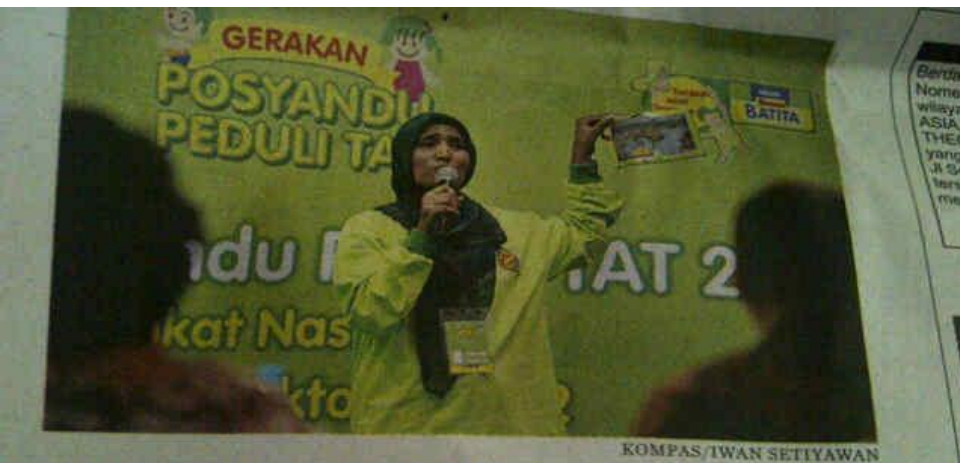
Seorang peserta mempresentasikan cara melakukan penyuluhan saat penilaian Kontes Posyandu Peduli Tumbuh Aktif Tanggap (TAT) di Jakarta, Rabu (17/10). Kontes yang diikuti kader-kader posyandu dari sejumlah daerah ini merupakan bagian dari gerakan posyandu peduli TAT untuk meningkatkan taraf hidup anak Indonesia