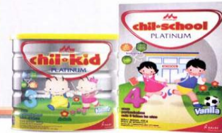
Untuk Generasi Platinum

Mari bentuk Generasi Platinum dengan pola asuh yang tepat karena mereka bisa mengubah Dunia!